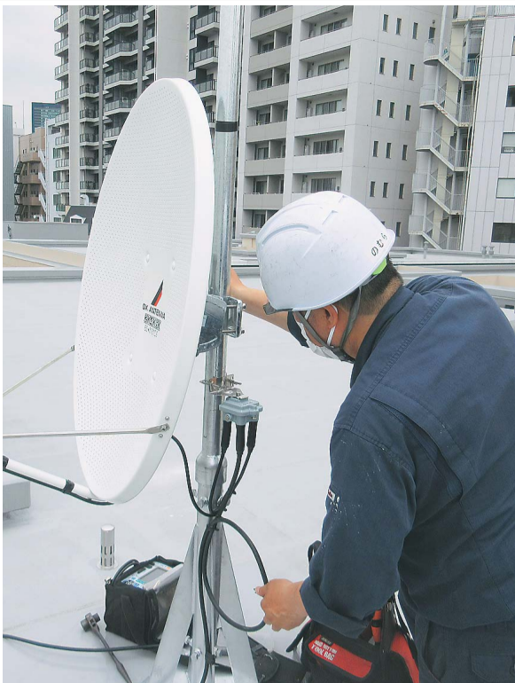
マンション共聴設備「定額保守サービス」実績推移